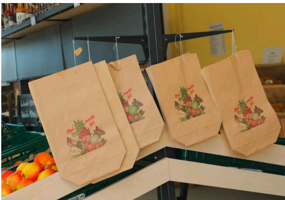
Wenn Sie neutrale Verpackungen ohne eigenes Logo nutzen, gelten Sie rechtlich als Hersteller. Dann ändert sich für Sie zunächst wenig.

und fragen Sie bei Ihrem Verpackungshersteller nach, ob er die erforderlichen Daten für Ihre Konformitätserklärung laut PPWR für Sie liefern kann. Doch auch wenn Ihr Lieferant Ihnen die technische Dokumentation erstellt und Ihnen die Konformitätserklärung zur Verfügung stellt und Sie diese nur abheften, bleiben Sie in der Haftung, falls die Angaben nicht korrekt sind. Sie übertragen zwar die Aufgaben der Erzeugerrolle, gelten jedoch rechtlich weiterhin als Erzeuger der Verpackung.