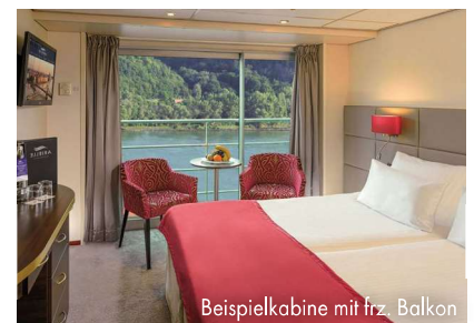
Beispielkabine mit frz. Balkon