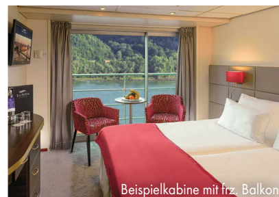
Beispielkabine mit frz. Balkon