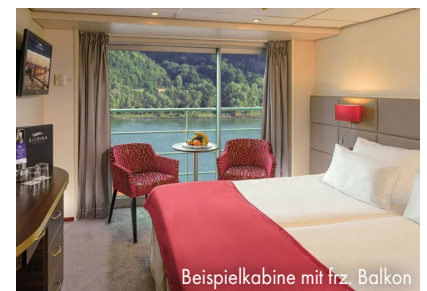
Beispielkabine mit frz. Balkon