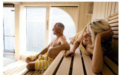
Deck 4 (Sonnendeck)