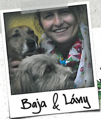
Baja & Lány